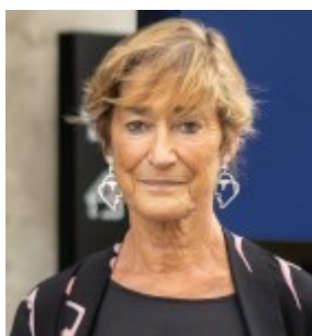
Victoria Ortega Benito (Abogada. Presidenta del Consejo General de la Abogacía Española)